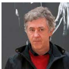
DARÍO URZAY ARTISTA PLÁSTICO PREMIOS NACIONAL DE ARTE GRÁFICO 2005